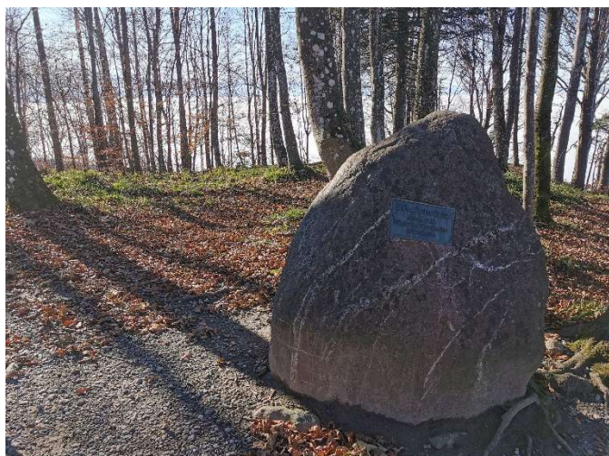
Höchster Punkt der Albiskette: Bürglen 915m