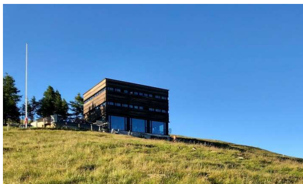
Capanna Monte Bar, sehr modern

Wanderroute: 1.Tag: Corticiasca 1008m –Piandanazzo 1603m – Cima Moncucco 1692m – Monte Bar 1816m – Cap. Monte Bar 1599m